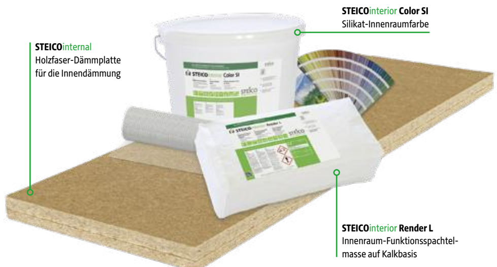
STEICOinternal Holzfaser-Dämmplatte für die Innendämmung

Alles aus einer Hand: Das neue STEICOinterior Beschichtungssystem auf Kalkbasis ergänzt die Vorteile von Holzfaser-Dämmplatten in einer aufeinander abgestimmten Produktlinie für den Innenbereich. Die diffusionsoffenen, sorptionsfähigen Komponenten unterstützen das Feuchtmanagement und können zu einem ausgeglichenen Raumklima und zum Schutz vor Schimmel beitragen.