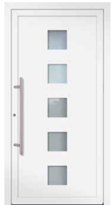
U d -Wert 1,23 1)

Farbe RAL 9007 Graualuminium FS Verglasung Satinato weiß LA 200 x 1.600 mm Mindestmaß = 800 x 1.990 mm