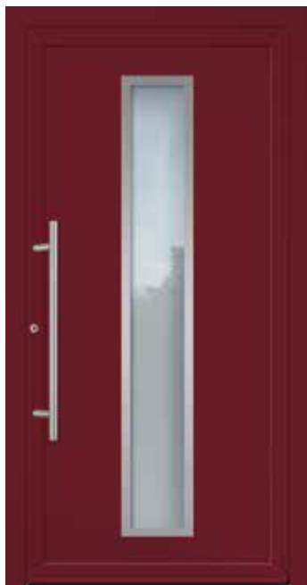
U d -Wert 1,23 1)