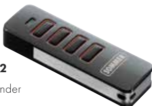
699252 Handsender Pearl