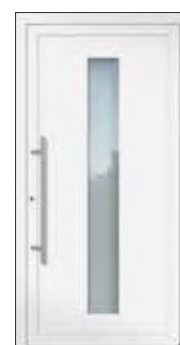
Höhe: 2.000 mm

Die Motivgrößen (Glasfelder) bleiben in der Höhe immer gleich und werden nicht individuell angepasst. Entsprechend wird bei abweichendem Höhenmaß der obere oder untere verbleibende Füllungsrand kleiner bzw. größer.