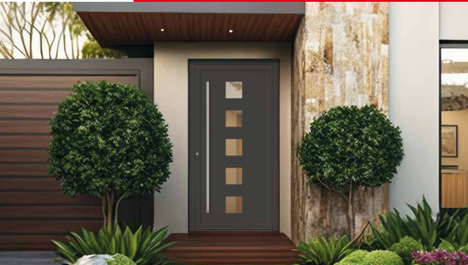
SMART 10 Farbe DB 703 Eisenglimmer FS / Verglasung Satinato weiß / Griff 3) S 1.600-1