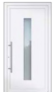
Höhe: 2.240 mm