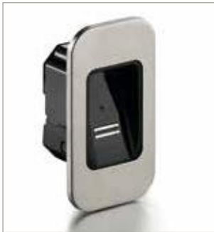
22052 ENTRAsys+ FD