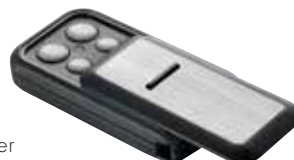
699626 Handsender Slider