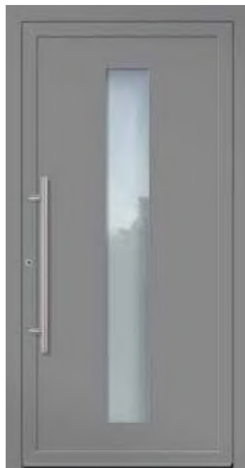
U d -Wert 1,23 1)

Farbe RAL 3005 Weinrot FS Verglasung Satinato weiß LA 200 x 1.600 mm Details Rahmen in Edelstahloptik außen Mindestmaß = 800 x 1.990 mm